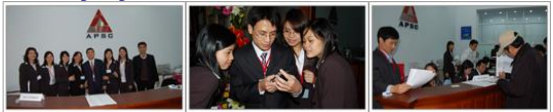
MỘT SỐ HÌNH ẢNH TẠI APSC: Từ trái qua phải, đội ngũ môi giới chứng khoán những ngày đầu thành lập, giao dịch qua điện thoại, khách hàng giao dịch tại sàn chứng khoán APSC.

Môi giới chứng khoán là hoạt động quan trọng và chiến lược của APSC. Với đội ngũ cán bộ quản lý và nhân viên có trình độ chuyên môn nghiệp vụ cao, có kinh nghiệm nhiều năm trong nghề môi giới và kinh doanh chứng khoán, APSC đã có một số lượng lớn khách hàng thân thiết là các nhà đầu tư cá nhân cũng như tổ chức trong và ngoài nước.